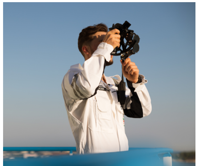
面对欺骗与干扰风险，传统导航技能仍是航运业不可或缺的保障。

在海上，GNSS是导航、通信时标同步、AIS及港口协调的核心基础。一旦船舶在近岸水域、主要航道或港口入口附近失去GNSS信号，船员操作的容错空间将急剧缩小。此时，船员必须立即依赖目视观测与雷达定位，并保持高度警觉。