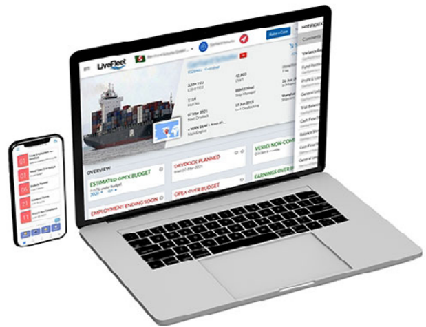
可配置性与灵活性: 量身定制 workflow、审批流程和仪表盘。