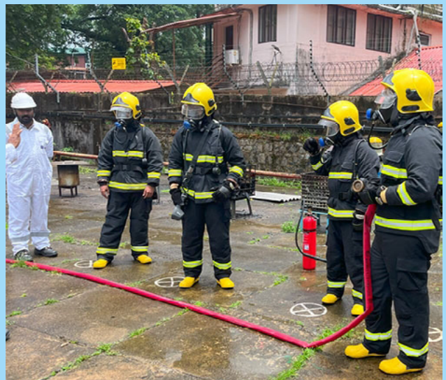
BSM为船员提供实操性的甲醇消防训练，以提升其海上安全准备与应急处置能力。

参训船员将在实操中学习和运用红外探测、抗醇泡沫、化学干粉、二氧化碳系统及水雾等一系列专业设备，准确识别并有效处置此类特殊火情。