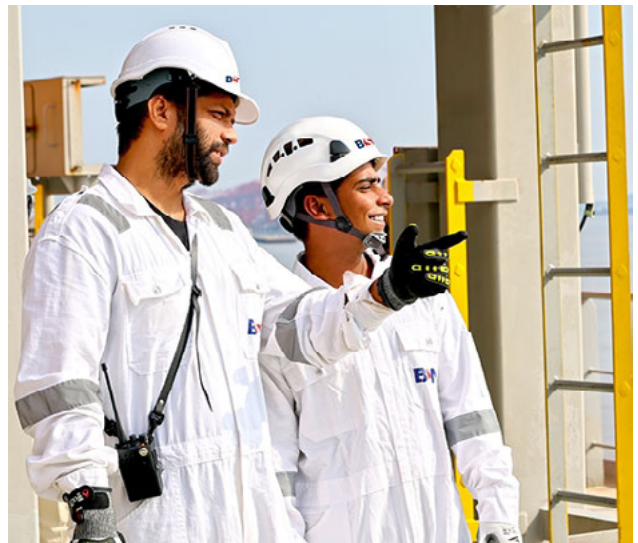
今天的船员必须既要心理强大、善于团队合作，又要能独立决策，习惯长期离家，还要精通科技。

数字化与人工智能已广泛应用于数据监测、计划性维护和电子日志。Rodriguez解释：“在BSM，这些功能已