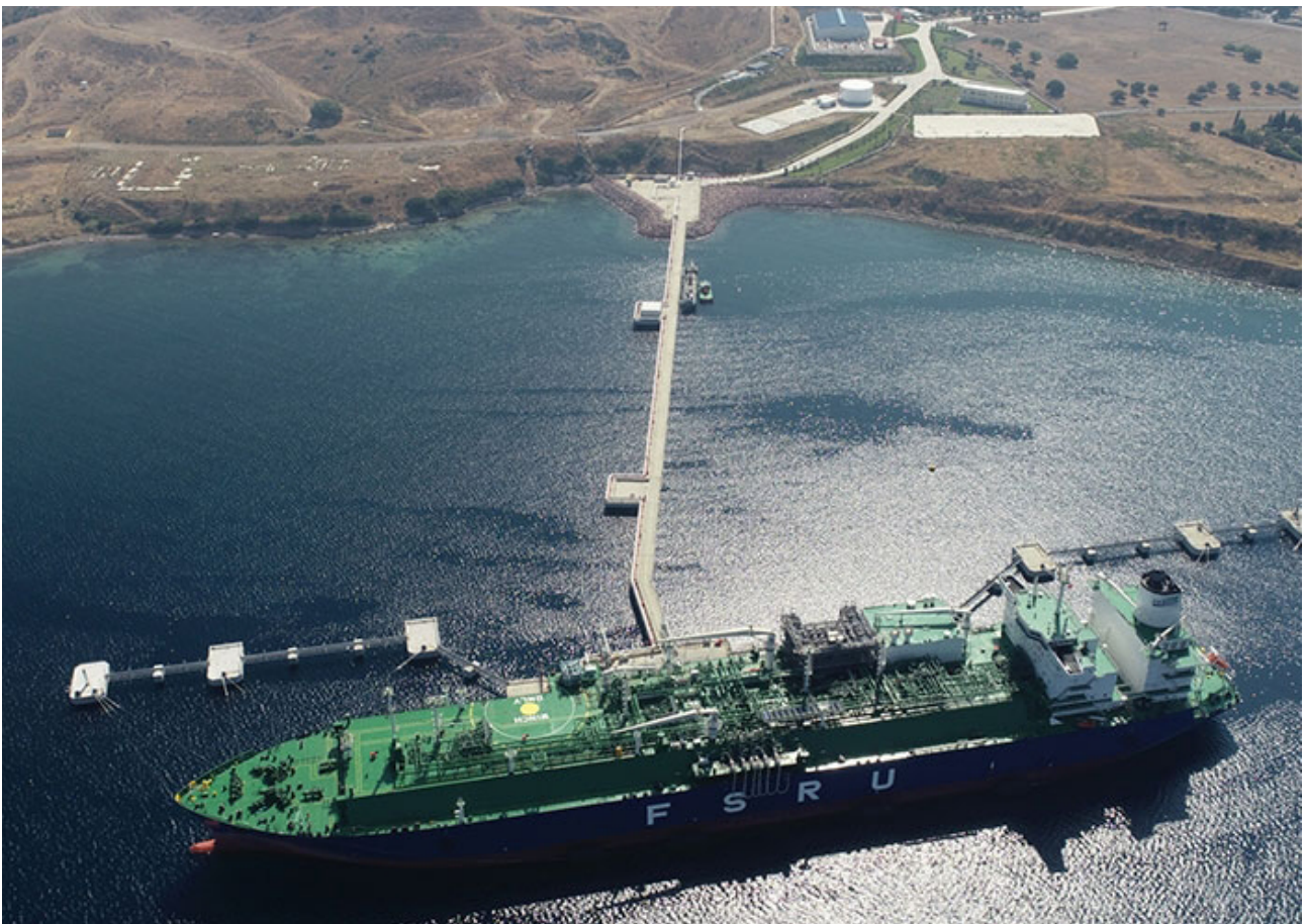
“Turquoise P”号FSRU是土耳其爱琴海Etki Liman LNG终端的组成部分。

目前全球仅有五十余艘FSRU在运营，其中由第三方船管公司管理的数量极少。Pronav凭借卓越的运营安全、质量、可靠性和效率，赢得了全球能源巨头、LNG租船方及终端的高度认可。Pronav在LNG船舶技术管理和船员配备方面已有超过25年的经验，涵盖最新一代双燃料发动机船型(MEGI & X-DF)、配备100%再液化装置的低速柴油船(Q-Flex)，以及传统蒸汽船（包括Moss球罐型和膜罐型）。